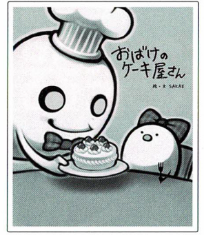
「おばけのケーキ屋さん」 (作: SAKAE マイクロマガジン社 刊)

今回取り上げる絵本は、お子さんはもちろん大人にも大人気の ユーモラスな『パンダ銭湯』と、 心あたたまる感動作『おばけのケーキ屋さん』。 コンサートでは絵本の絵を投影し、朗読を聞きながら、 その世界を表現した音楽をお楽しみ頂きます。