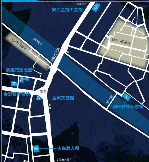
map 4 : 東山界限